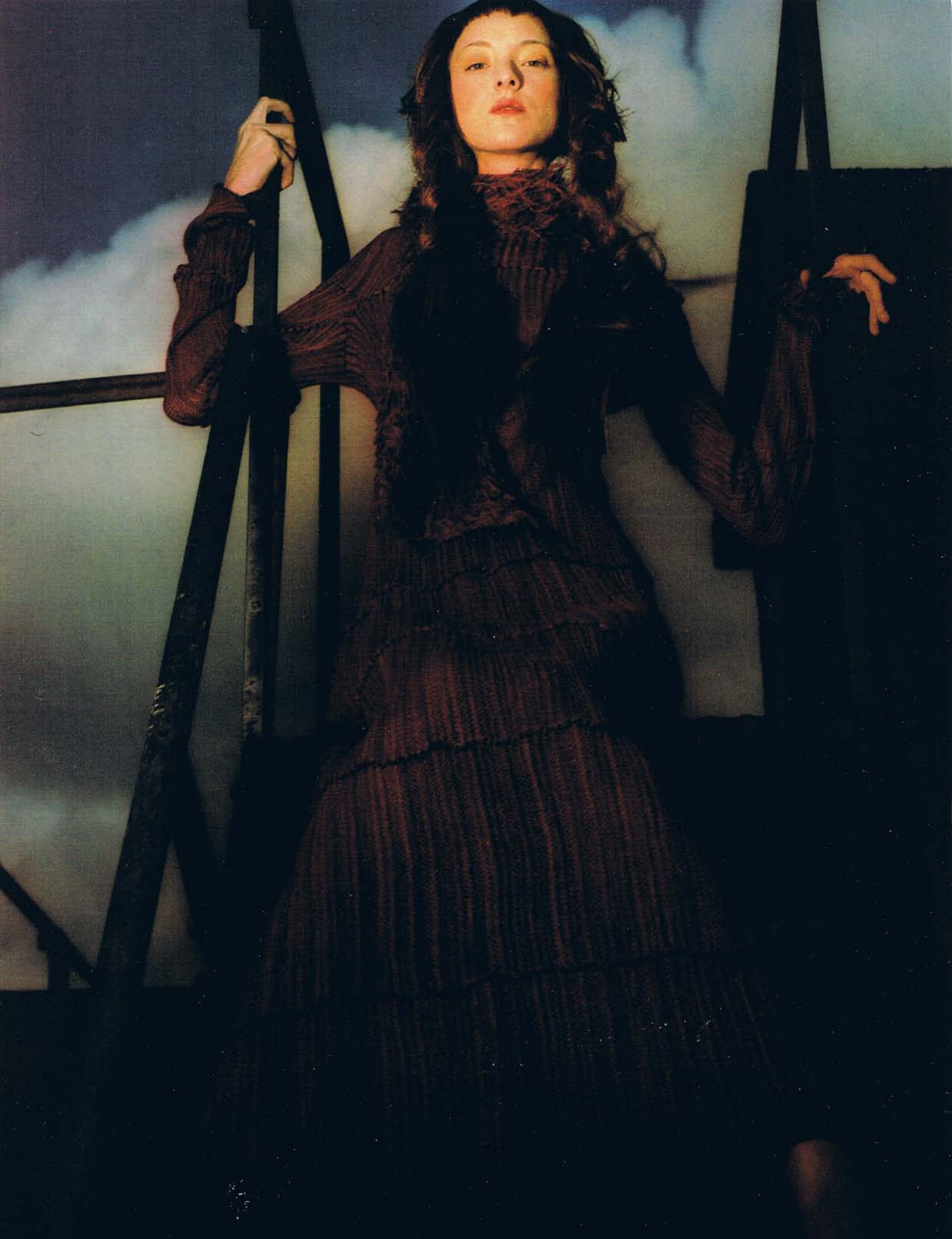
Pletilni studio Draž, kreacija Urša Draž