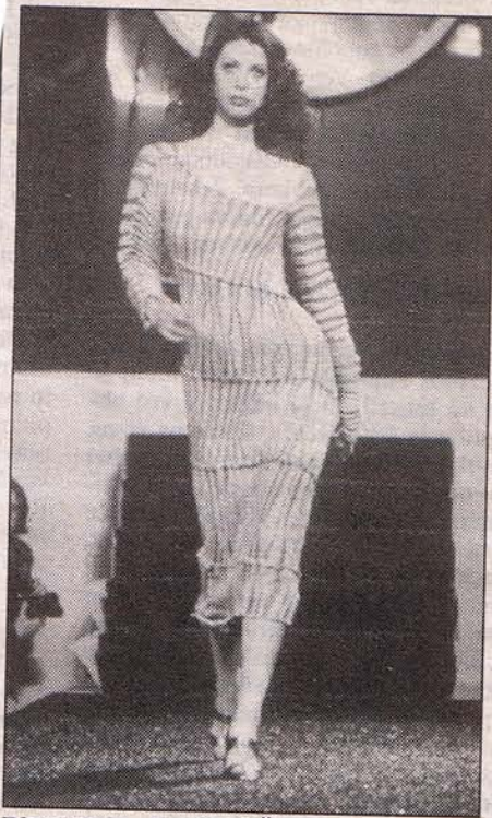
Pletilni studio DRAŽ