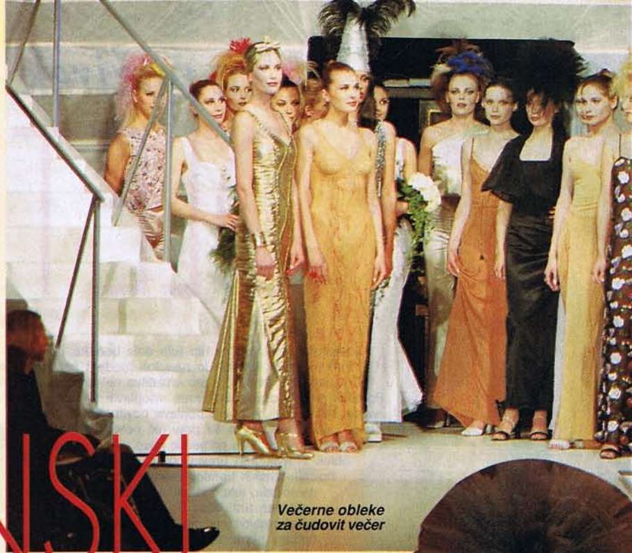
Večerne obleke za čudovit večer