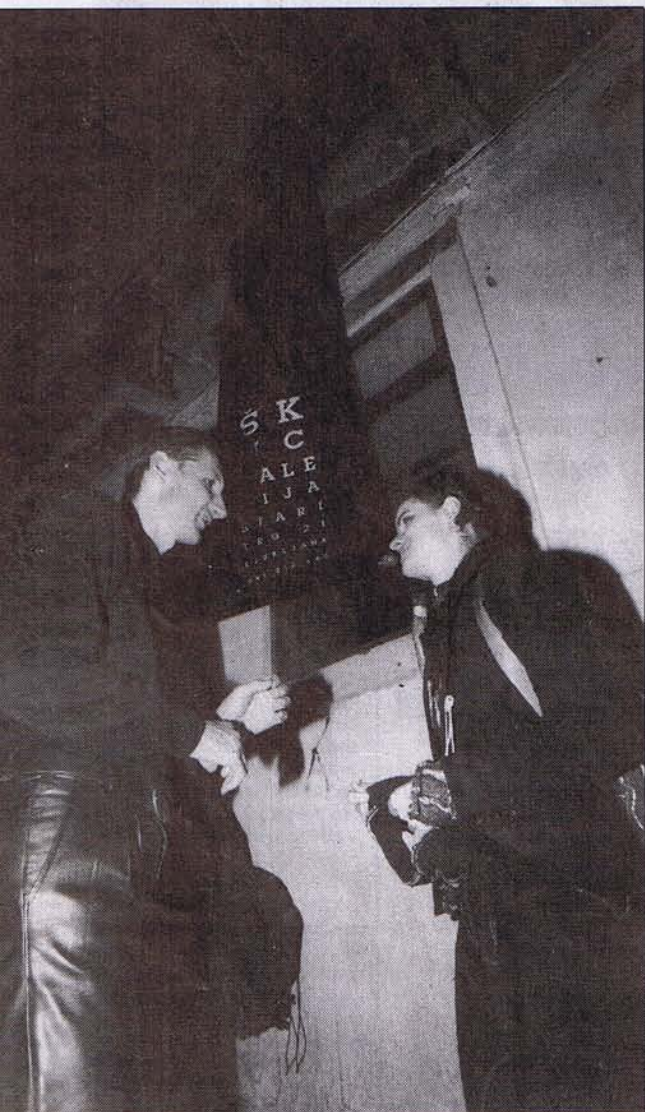
Galerija Škuc v starem delu Lizbone.

T olikšne mladostniške energije že dolgo ni bilo zaznati na evropskih tleh kot prav v Lizboni, kjer se je 24. novembra končal bienale mladih umetnikov Sredozemlja. Bila je to tudi letošnja prestolnica evropske kulture. Bienala so se udeležili tudi slovenski umetniki; brez njih bi bil program gotovo siromašnejši, saj so z dovolj reklamiranimi nastopi navdušili lizbonsko oz. predvsem bienalno občinstvo. Na hrvaške in nekatere italijanske umetnike so slovenski »trčili« že v Trstu, odkoder je letalo Alitalia poletelo najprej v Rim, od tam pa v Lizbono.